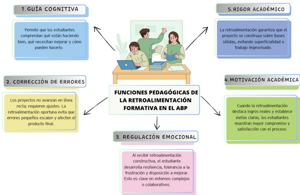
Figura 2. Funciones pedagógicas de la retroalimentación formativa en el ABP

Los resultados de la revisión destacan la evaluación formativa como un componente central del Aprendizaje Basado en Proyectos. La literatura señala que la efectividad del ABP depende en gran medida de la calidad de los procesos de evaluación y retroalimentación implementados durante el desarrollo de los proyectos (Hattie & Timperley, 2007).