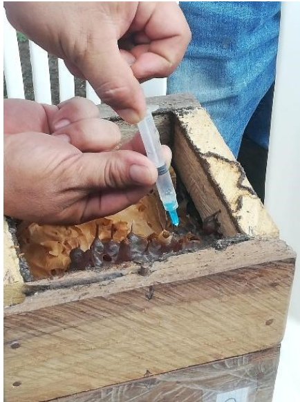
Gráfico 4. Extracción de los potes de miel. Autoría propia.

La técnica que los productores utilizan para la extracción de la miel de los potes se realiza con una jeringa, este método va a permitir la extracción de una manera limpia y a su vez, evita causarles daño a las abejas meliponas y a los potes de miel como se observa en el Gráfico 4.