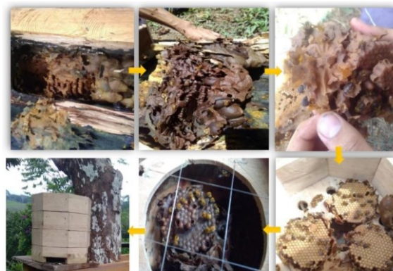
Gráfico 1. Proceso de traslado de una colmena. Autoría de Román 2021.