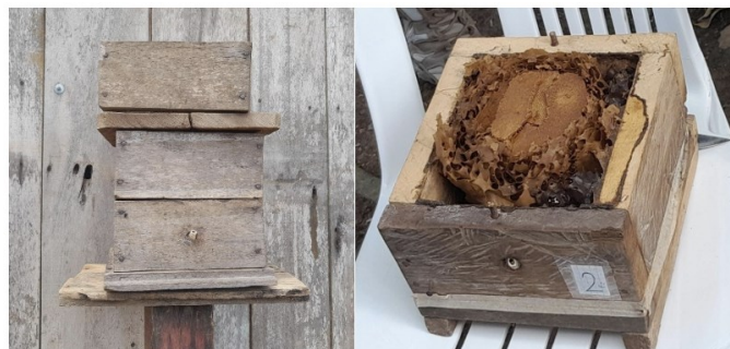
Gráfico 2. Colmenas artificiales creadas por los productores utilizando materiales de la zona. Autoría propia.

Para el desarrollo de este punto, se realizaron visitas y entrevistas a los productores en el mes de diciembre, logrando destacar que los productores realizan sus propias colmenas artificiales para la respectiva crianza de las abejas melíponas. Estas colmenas se elaboran con materiales de la zona como la madera que se encuentra en sus alrededores (Gráfico 2). Además, se van agregando los niveles de las colmenas en dependencia del desarrollo de la misma. Las principales abejas que los productores tienen en sus colmenas son: la abeja Angelita ( Tetragonisca angustula ) y la abeja Real o Reina ( Melipona aburnea ).